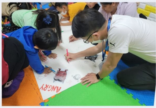
After-school Parent -child Story Telling Club