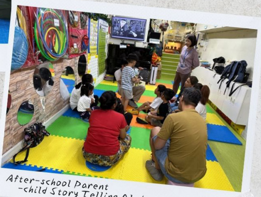
After-school Parent -child Story Telling Club