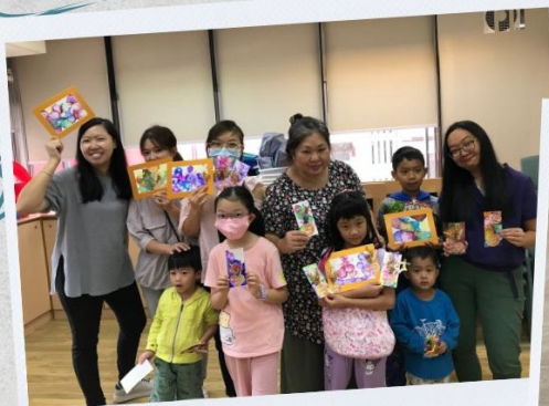
親親爸媽 酒精墨工作坊