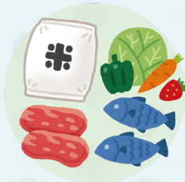
Making nutritious food (for all ages)