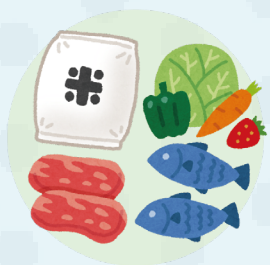
營養飲食(任何年齡)