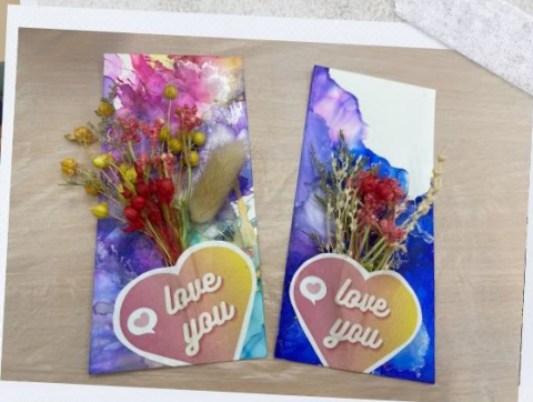
親親爸媽 酒精墨工作坊