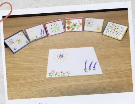
喜. 越. 手作?