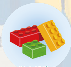
樂高認真玩 Lego® serious play®