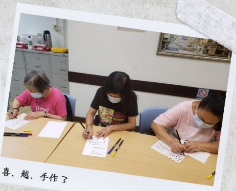
喜. 越. 手作?