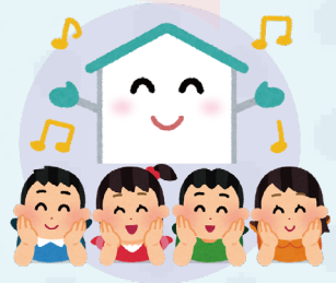
Child safety at home