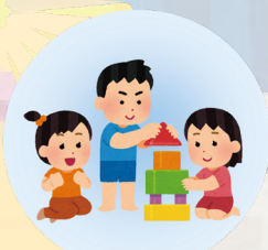
兒童為本遊戲治療

由受過專業訓練及曾運用遊戲治療的註冊社工負責，以各種遊戲治療手法為離異家庭或父母有情緒困擾的兒童及家長提供個別遊戲治療 / 諮詢、小組及活動，讓兒童抒發內心感受和建立自信心，同時讓家長了解兒意的內心世界，促進親子關係。