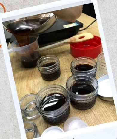
茶雲膏 動手做 2024