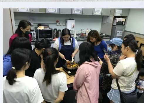
茶雲膏 動手做 2024