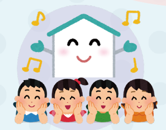
Child safety at home